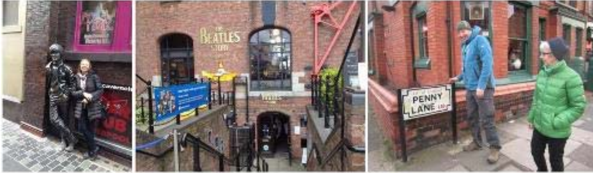
Foto links: Das kann sich keiner verkneifen: einmal in der Matthew Street neben John ...

SONDERPREISE FÜR M.B.M.s - bitte beim Veranstalter erfragen.