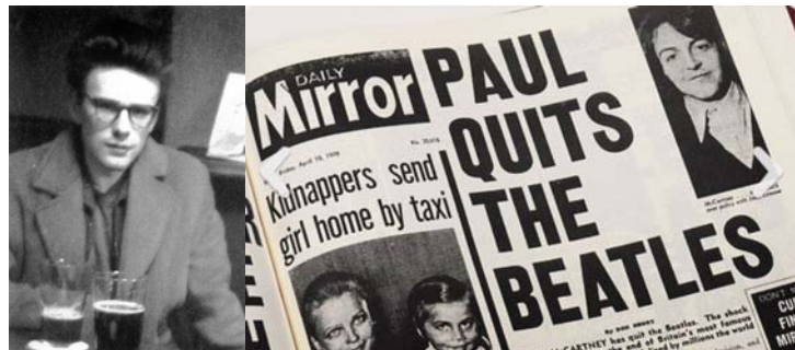
Abbildung rechts : STUART SUTCLIFFE 1959 in Liverpool; Abbildung rechts : Zeitschrift "Daily Mirror" mit der Meldung über die Trennung der BEATLES vom 10. April 1970

dass er sich aufgrund persönlicher, musikalischer und finanzieller Differenzen von den BEATLES trennt.