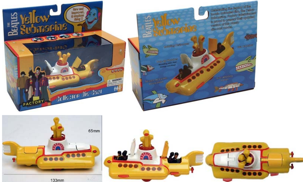
Abbildungen obere Reihe: YELLOW SUBMARINE in Box von vorne und von hinten