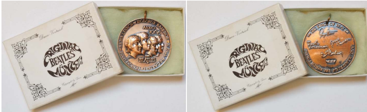
Abbildung: Vorderseite der Münze im Originalkarton / Vorderseite der Münze im gleichen Originalkarton

1966: Original-BEATLES-Souvenir-"Münze" von 1966 15,00 Euro im Original-Karton mit Original-Aufdruck.. Durchmesser der "Münze" ca. 4 cm