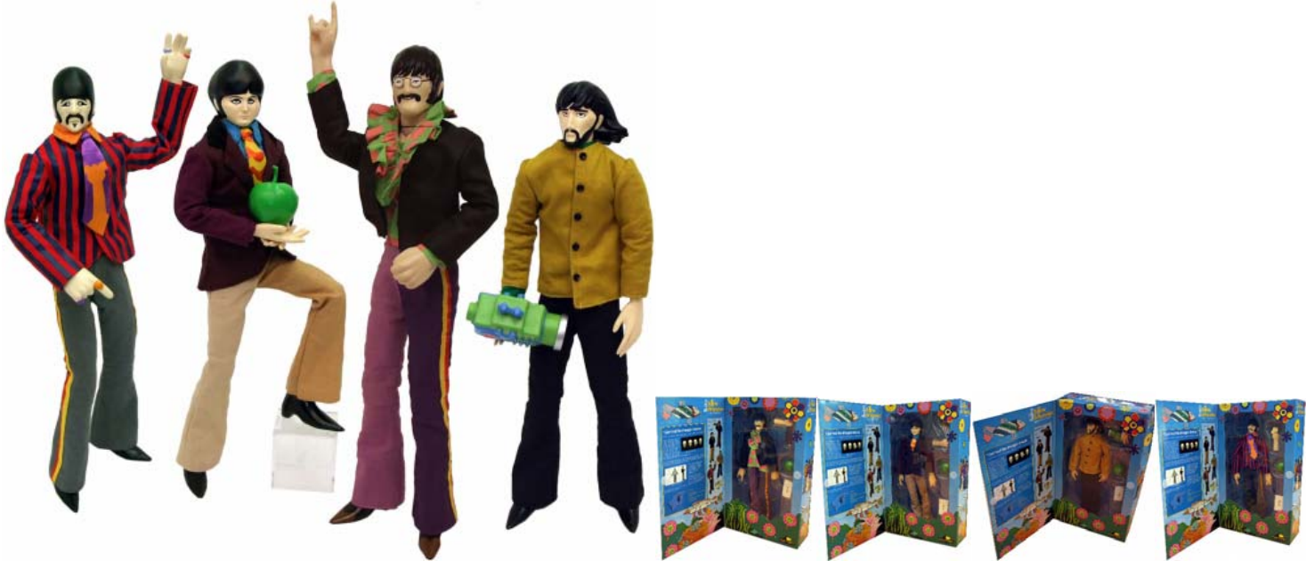
Abbildung von links: Figuren ohne Display; Figuren in den Präsentationsboxen (aus starkem Karton, sehr verkleinerte Abbildungen)

Sehr große Plastik-Figuren (33,5 cm hoch) mit Stoffkleidung JOHN, PAUL, GEORGE & RINGO YELLOW SUBMARINECOLLECTION SET. 449,00 € MEHR INFO