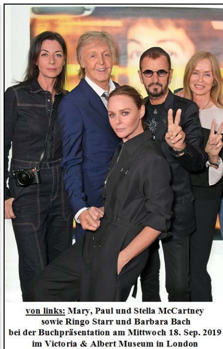
von links: Mary, Paul und Stella McCartney sowie Ringo Starr und Barbara Bach bei der Buchpräsentation am Mittwoch 18. Sep. 2019 im Victoria & Albert Museum in London

von links: Buch / Foto von Buchpräsentation