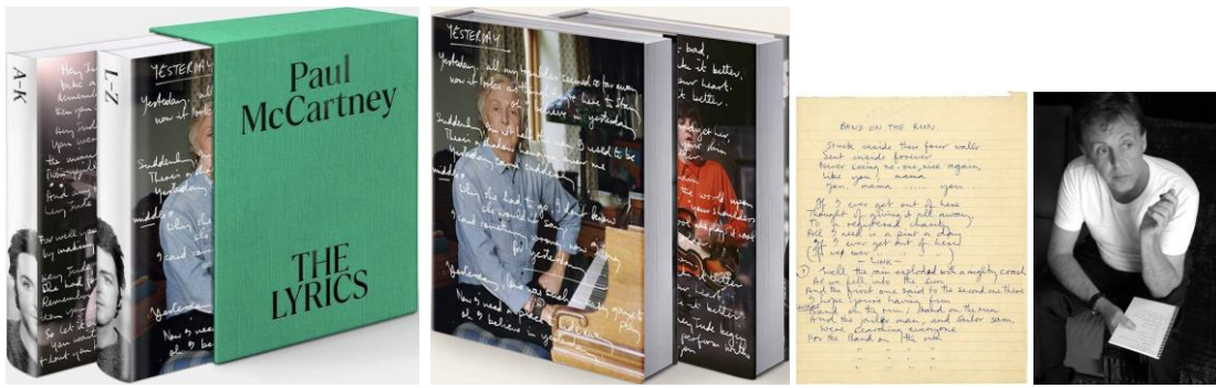
Abbildungen von links: Zwei Bücher in Box / Zwei Bücher / Text Band On The Run / Promotionfoto (wahrscheinlich McCartney im Mai 2003).