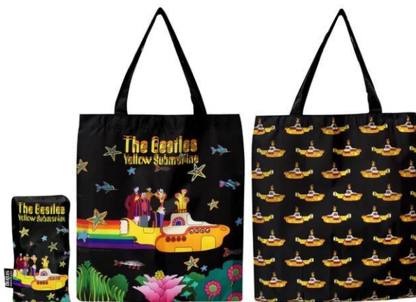
Abbildungen von links: Einkaufstasche YELLOW SUBMARINE zusammengefaltet / von vorn / von hinten.

Versendung (gut verpackt) als Brief (mit Deutscher Post). /// Shipment (well packed) as letter (with German Post).