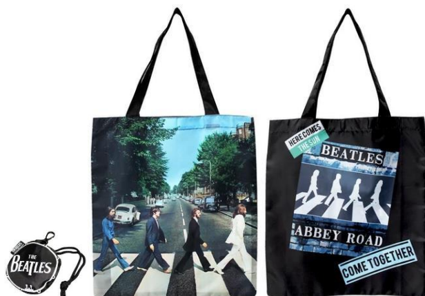
Abbildungen von links: Einkaufstasche ABBEY ROAD zusammengefaltet / von vorn / von hinten.

Material: Kunststoff aus 100 % recycelten Plastikflaschen / Format (ohne Griffe): 38,0 cm x 33,0 cm.