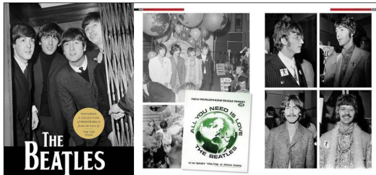
Abbildungen von links: Cover des Buches THE BEATLES: FEATURING ... / Innenseiten 244 und 245.

Versendung (gut verpackt) per Paket mit DHL (Info über Sendeverlauf kommt per E-Mail). Shipment (well packed) as parcel with DHL (info about sending process will be sent by e-mail).