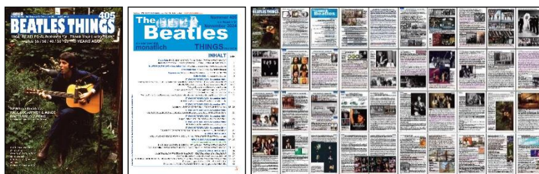
Abbildungen von links: Titelseite und Inhaltsverzeichnis für BEATLES THINGS DEUTSCH 405 / alle 40 Seiten (verkleinert)