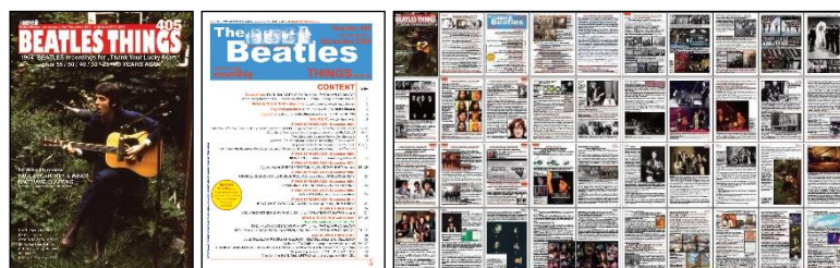
Images from left: Cover and index page for BEATLES THINGS ENGLISH 405 / all 40 pages (reduced images)

PS: Regelmäßig THINGS AUDIO? Schreibe uns bitte: BeatlesMuseum@t-online.de