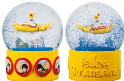
Abbildungen von links: Schneekugel YELLOW SUBMARINE von vorn & hinten.

Versendung (gut verpackt) per Paket mit DHL (Info über Sendeverlauf kommt per E-Mail). Shipment (well packed) as parcel with DHL (info about sending process will be sent by e-mail).